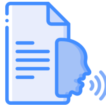
ផ្លាស់មាត់