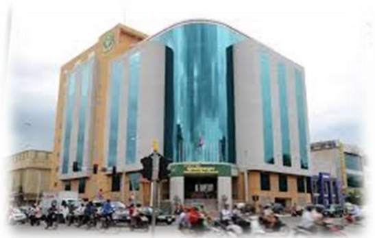
រដ្ឋបាលសារពើពន្ធ

“ត្រូវមកធ្វើបច្ចុប្បន្នភាពព័ត៌មានក្នុងកំឡុង ១៥ថ្ងៃ ក្រោយពីផ្លាស់ប្តូរ អាសយដ្ឋាន ទ្រង់ទ្រាយ នាមករណ៍ កម្មវត្ថុអាជីវកម្ម ការផ្ទេរ ការបញ្ឈប់អាជីវកម្ម សមាសភាពអ្នកគ្រប់គ្រង ឬអ្នកទទួលបន្ទុកកិច្ចការពន្ធដាររបស់សហគ្រាស។”